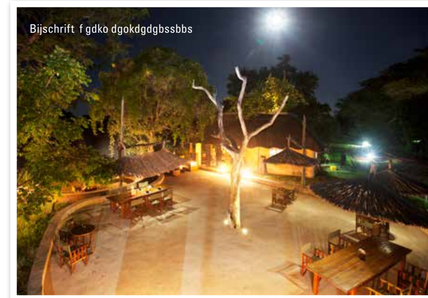
Bijschrift f gdko dgokdgdgbsbbs

De Luangwa rivier die langs Track & Trail River Camp loopt vormt een natuurlijke grens met het nationaal park, één van de laatste echte wildernissen van Afrika met hoge concentraties nijlpaarden, giraffen, zebra’s en ruim 400 verschillende vogelsoorten. Kirsten: “Daardoor kom je ook op ons terrein regelmatig wilde dieren tegen: vooral