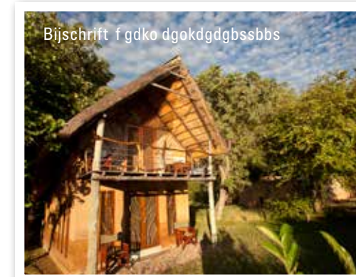
Bijschrift f gdko dgokdgdgbsbbs