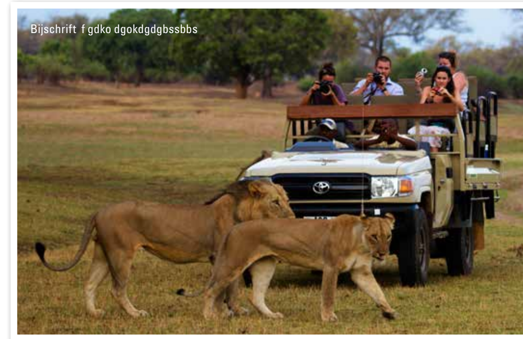
Bijschrift f gdko dgokdgdgbsbbs

‘Onlangs vonden we een krokodil in onze visvijver. Het blijft heel bijzonder om tussen de wilde dieren te leven’